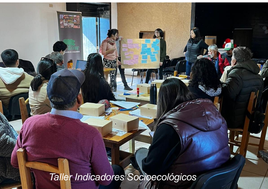
Taller Indicadores Socioecológicos