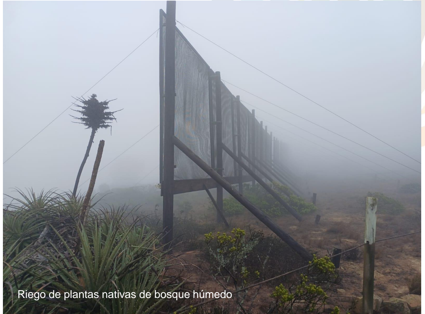
Riego de plantas nativas de bosque húmedo