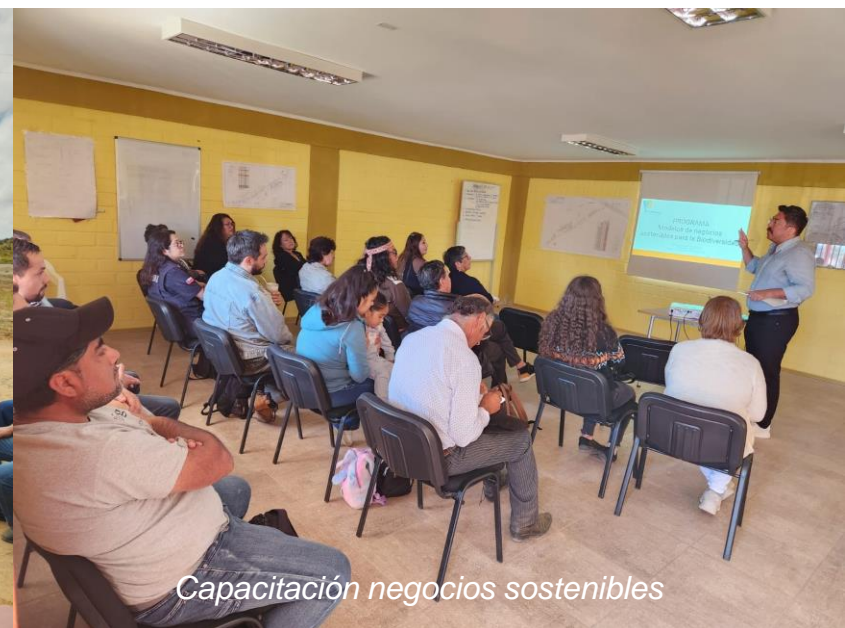
Capacitación negocios sostenibles