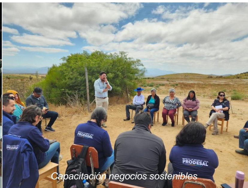
Capacitación negocios sostenibles